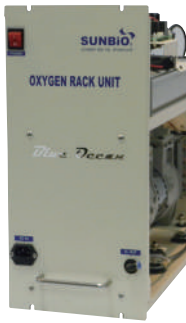
RACK Unit Basic