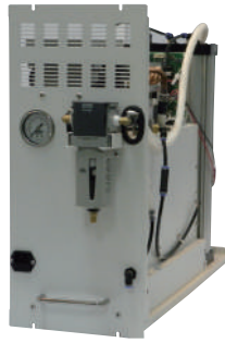
RACK Unit Extension